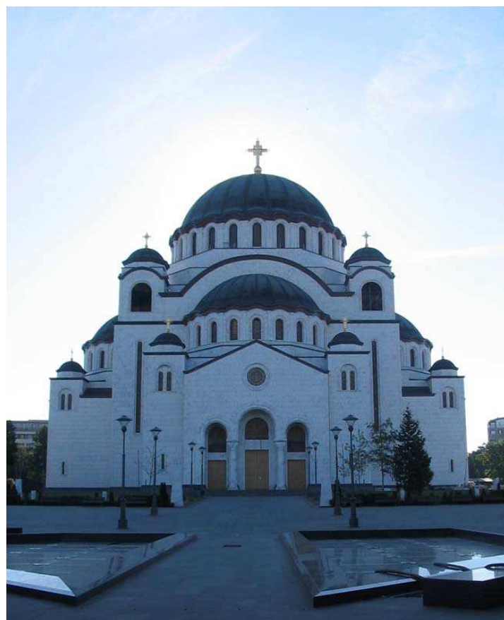
St. Sava Church in Belgrade

During this period the Serbian people, wherever they may have resided, started their uprising against Turkish rule. Gradually the conditions were created to begin the era of stateliness in 1804.