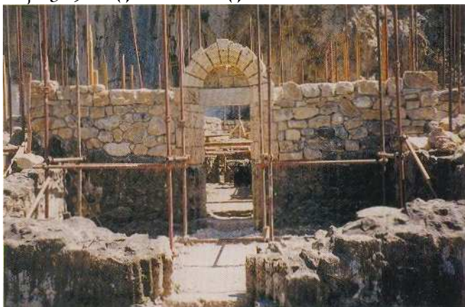
Зидине манастира пре обнове