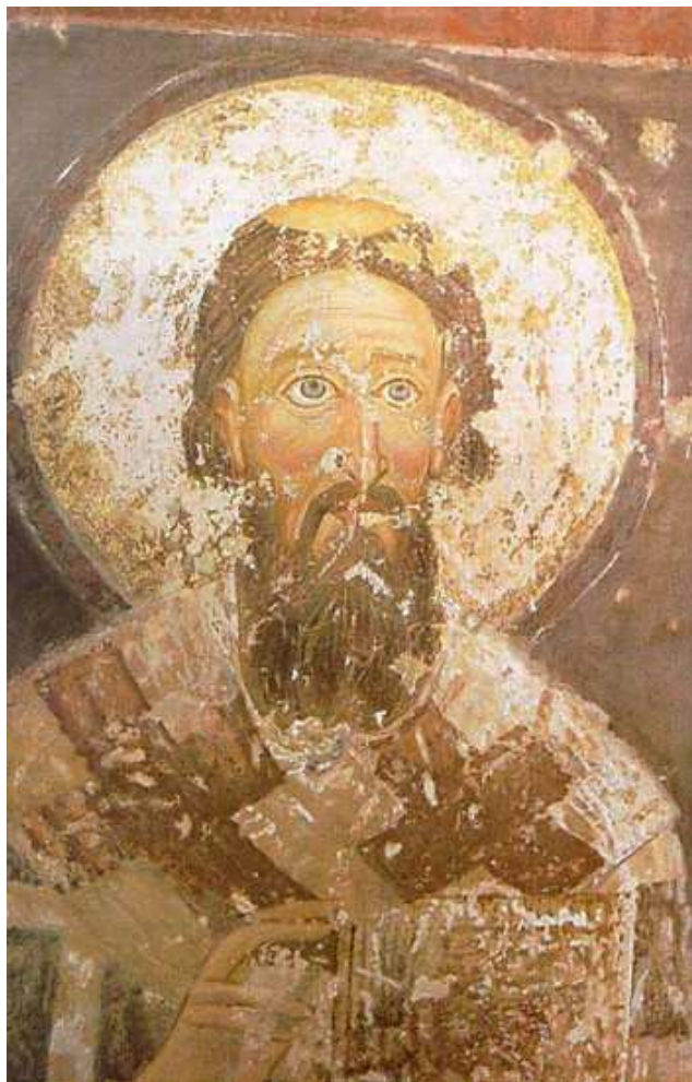
Свети Сава, Први Српски Архиепископ

У овом периоду српски народ где год живео и био расељен почињао је да устаје против турске власти. Постепено су се стварали услови за оно што ће касније наступити године Господње 1804.