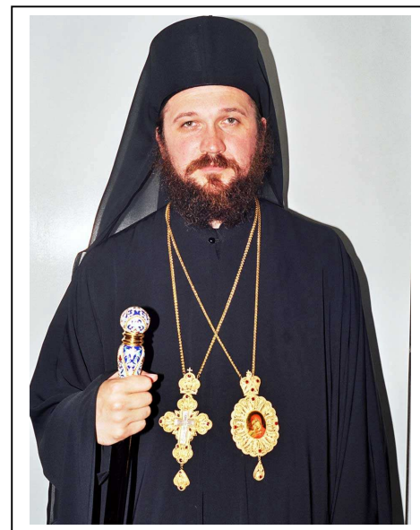
Митрополит Амфилохије, Епископ Јоаникије и Епископ Јован

Канонски архијереји Српске Православне Цркве у Црној Гори и њени истински служитељи и бранитељи