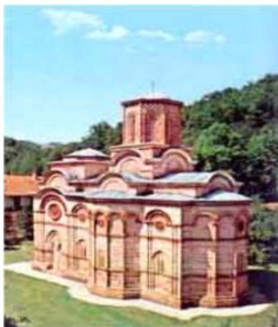
The monastery Kalenic

The monastery Kalenic is located on an inclination with a mountain view, west of the village Oparica in Levac. Of the original Monastery complex only the church inducted to the mother of Christ remained. This monastery was erected and decorated with frescos at the beginning of the 15 th century between 1407 and 1413 founded by the dignitary Bogdan who served as a senior clerk at the court of King Stefan Lazarevic. The monastery is regarded as one of the most beautiful tributes to the Morava school of art and architecture and Byzantine construction.