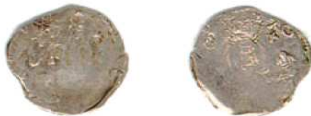
Coins of Stefan Lazarevic

arrangement with Hungary and create an important feudal agreement where he could once again have Macva and Belgrade. The Despot found Belgrade in ruins but thanks to his alliances Belgrade quickly recovered. Slowly Belgrade became one of the most important centers in Serbia.