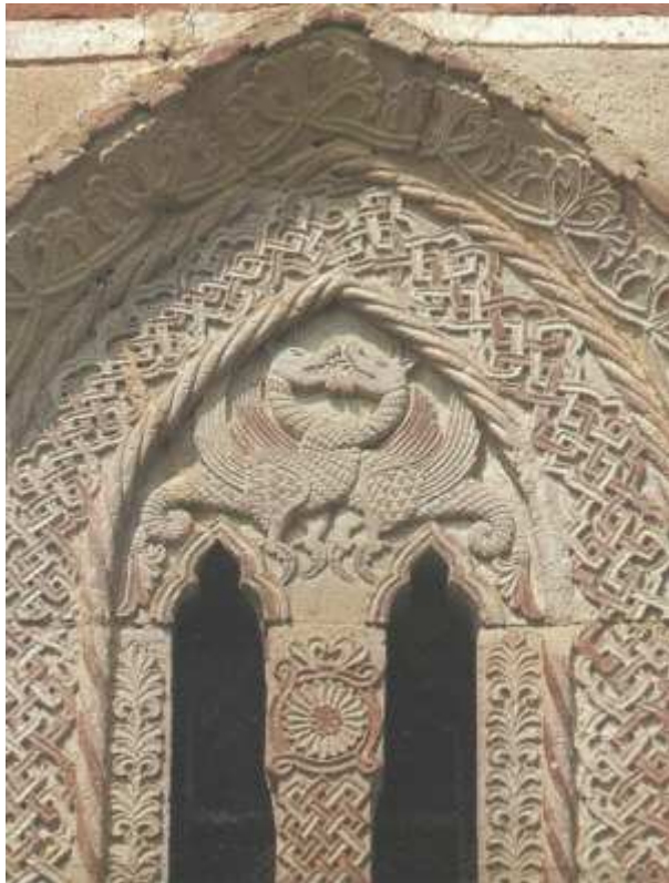
детаљ са фасаде

преплет од двочлане траке, стилизовани љиљан и палмета, антропоморфне и зооморфне представе.