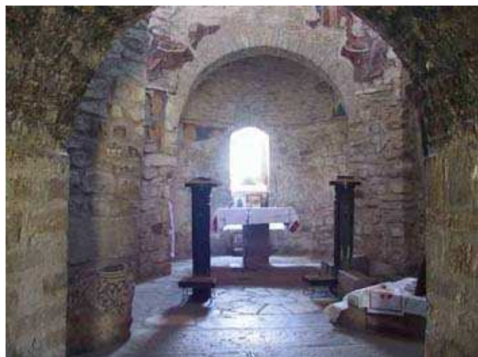
Унутрашњост Петрове цркве