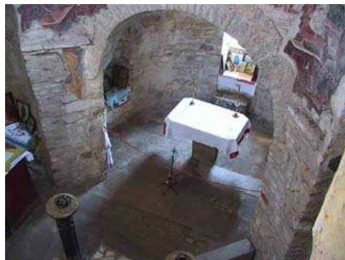
Inside of St. Peter's church

Ако желите да уживате у звуцима „домаће,, музике или да чујете шта је то ново у српској заједници у Калгарију СРПСКИ РАДИО КАЛГАРИ је ту да вас забави и информише! Слушајте нас сваке недеље навече: од 7 до 8 часова на 94.7 ФМ ХРИСТОС ВАСКРСЕ!!!