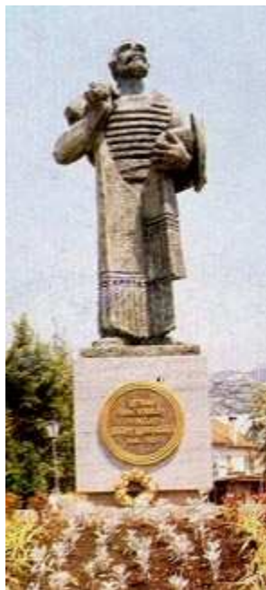
Статуа Ивана Црнојевића

По освајању Србије турци се упућују према Босни коју после великих борби освајају 1481. г.Г. Те године једина слободна српска земља била је Зета под влашћу Црнојевића.