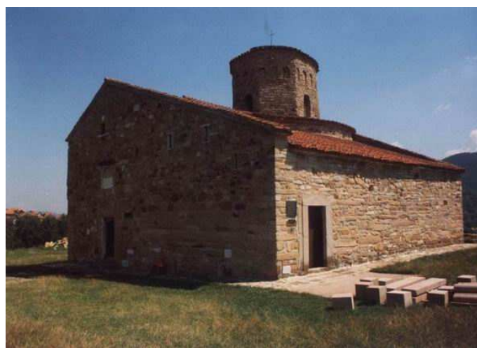
St. Peter's church-entrance

St. Peter's church is one of the oldest churches on the canonical territory of the Serbian Orthodox Church. It was built in 7th century. It is very well known as the earliest spiritual center in the Ras area where the first Serb state was created under great Zupan Nemanja in 11th century. It was in this church that Nemanja was baptized. Later this first ruler of an organized Serb state become a monk in Mount Athos where he and his son St. Sava, the first Archbishop of Serbia established the monastery of Hilandar.