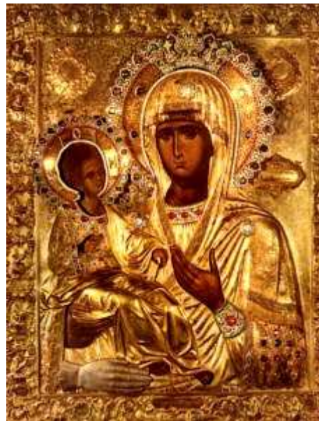
Icon of mother of God from monastery Hilandar

The monastery, in centuries to follow, was endowed by all the Serbian rulers making it one of the most respected monasteries on Sveta Gora. Even today this monastery is the center of Serbian spirituality.