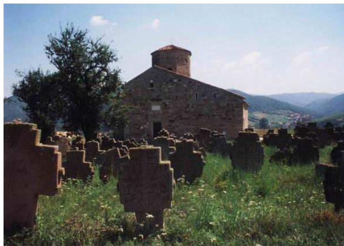
Гробље у околини цркве

Петрова црква је једна од најстаријих цркава на канонској територији Српске Православне Цркве. Саграђена је у седмом веку. Црква је позната као најранији духовни центар у Расу, где је успостављена и прва српска држава под влашћу великог жупана Стефана Немање у једанаестом веку. У Петровој цркви је и сам Немања био крштен. Касније је овај српски владар постао светогорски монах и заједно са својим сином Светим Савом, првим српским архиепископом, саградио манастир Хиландар.