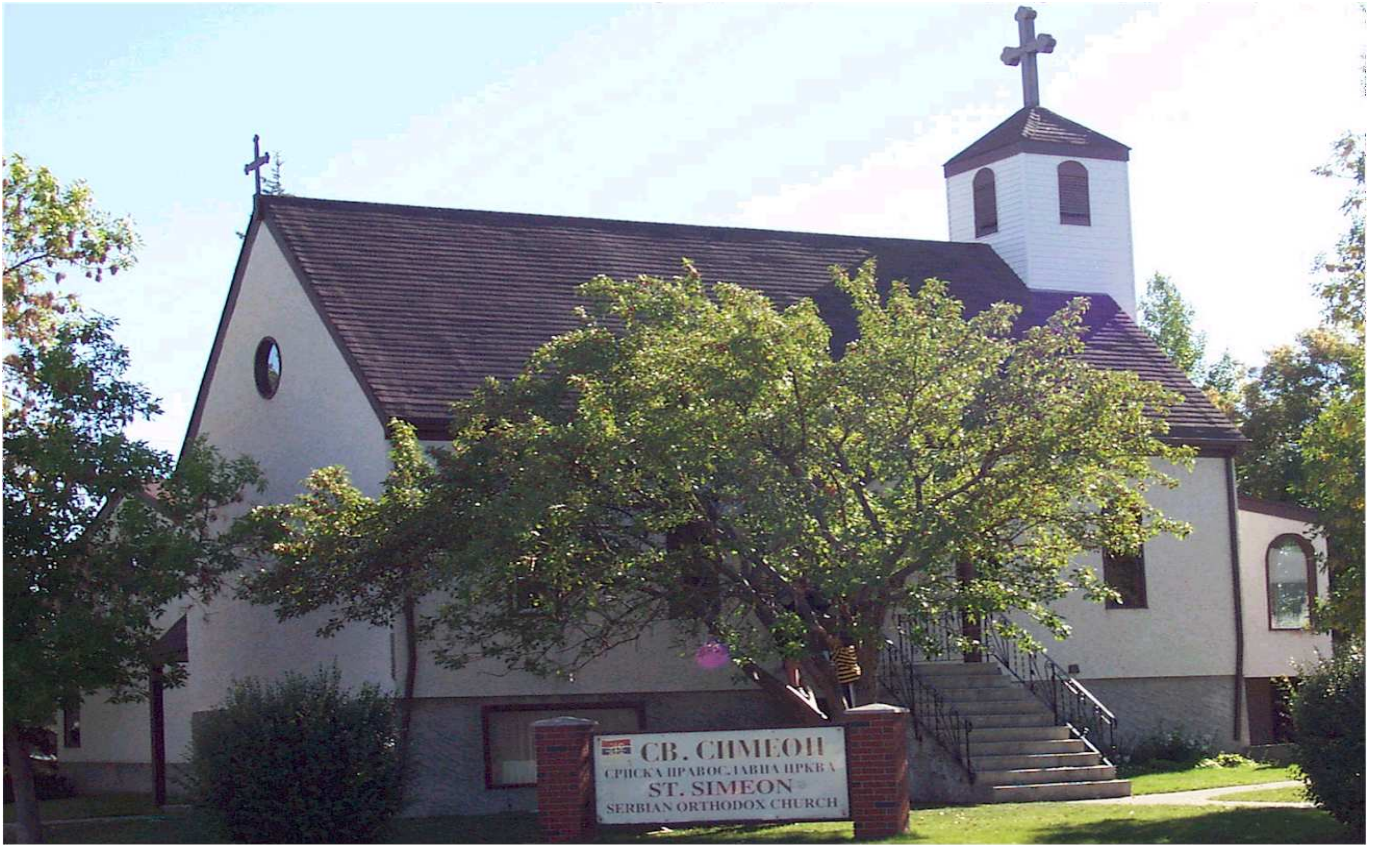
Српска Православна Црква Светог Симеона Мироточивог у Калгарију Serbian Orthodox Church St. Simeon Mirotocivi in Calgary