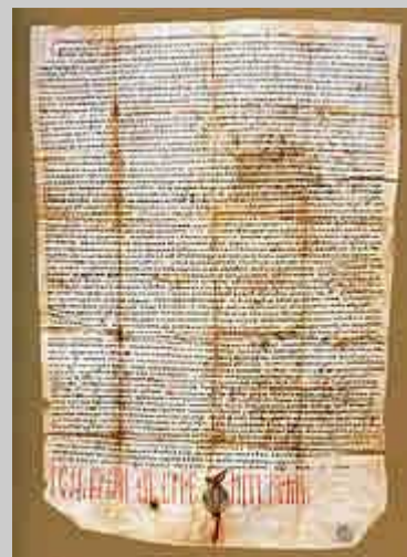
Хрисовуља цара Душана