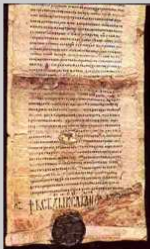
Карејски типик са потписом Светог Саве