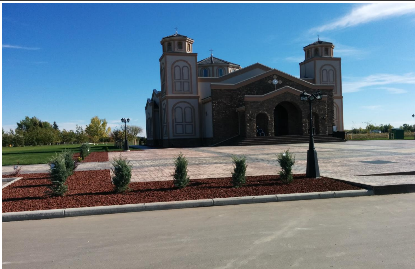
Serbian Orthodox Church St. Simeon Mirotocivi