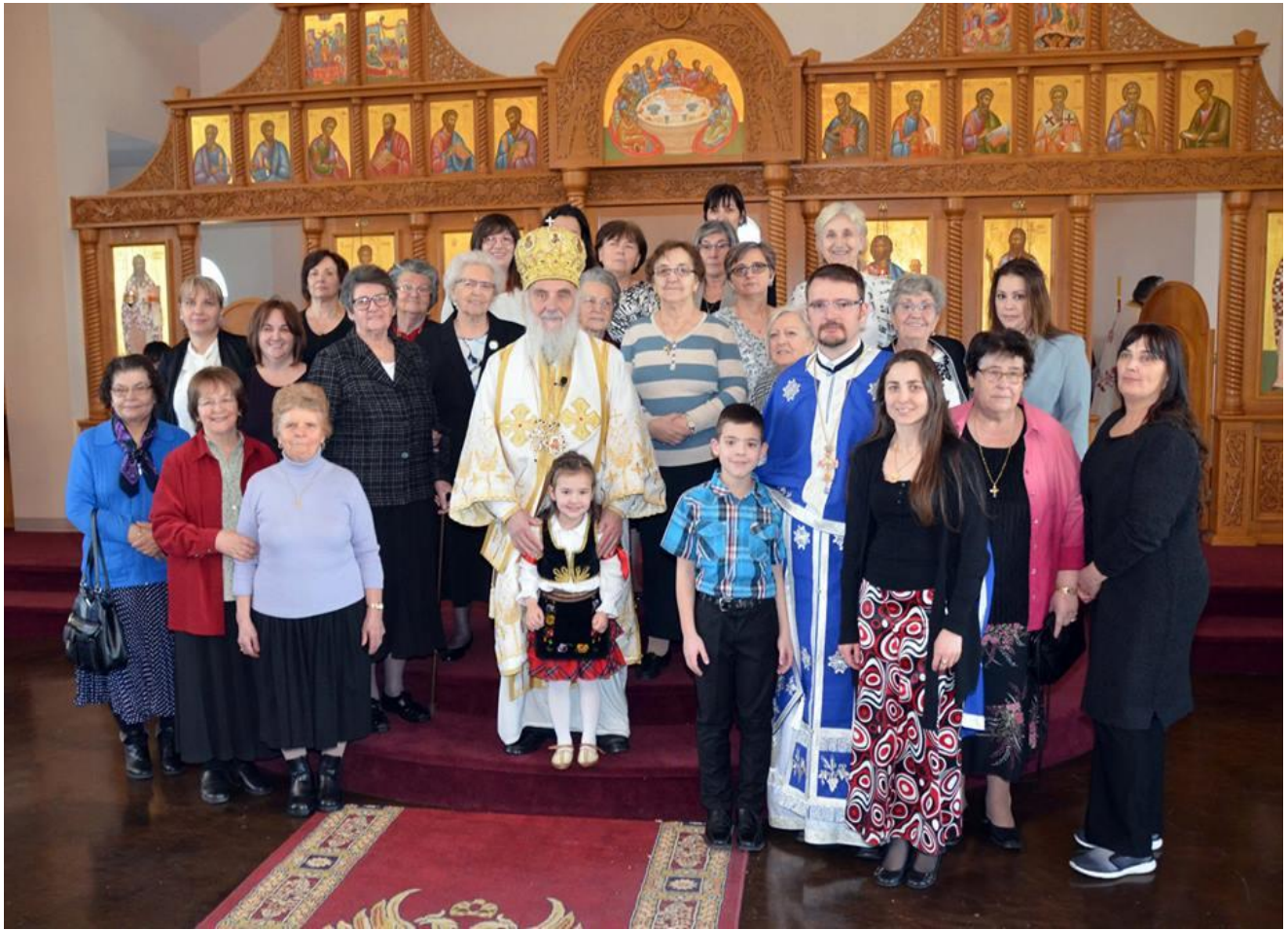
Чланице Кола Српских Сестара „Мала Госпојина“

Свим читаоцима Парохијског Гласника, Свим Србима и Српкињама у нашем граду и свуда у отаџбини и расејању, честитају празник рођења Господа и Бога и Спаситеља нашега Исуса Христа!