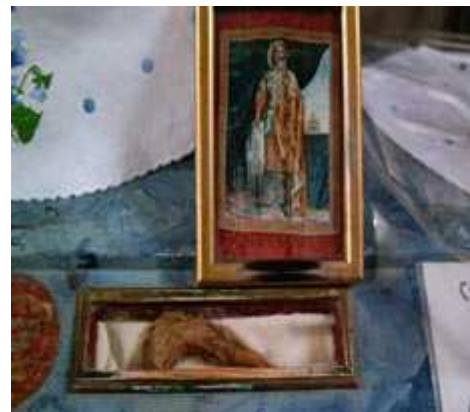
Holy remains od Tzar Lazar

According to reports it was founded during the time of Seraf the metropolitan of Srem before the arrival of the Ottomans. However it was first mentioned in Turkish records in the years 1566-67 as the St. John monastery whose monks were forced to abandon it due the fact they were unable to pay taxes to the Turks. The deserted and ruined monastery was populated by the monks from Ravnica Serbia during the major migration of Serbs into Vrdnik in 1697 which along with them brought the holy remains of Tsar Lazar and treasures from Ravnica. From then on Vrdnik was known as Ravnica. The monks then rebuilt the church and established a new commemorative day dedicated to the Ascension of Christ. Since the support for Prince Lazar was spreading fast among the Serbs, in 1801 to 1811 a new church was built and Lazar's holy remains were brought into it in 1811 hence making the monastery renowned.