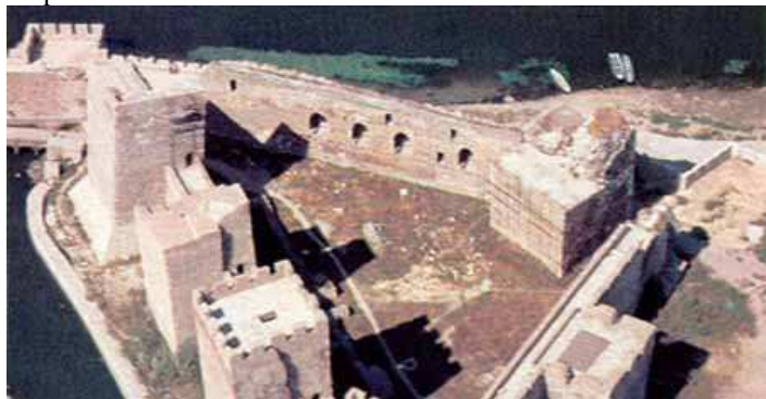
Смедерево као престоница деспотовине

Године Господње 1428. деспот Ђурађ одлучује да сагради нови град Смедерево и у њега пресели своју престоницу. Изградња је завршена у року од две године, у народу је остало предање да је деспот наметнуо велике порезе и да је народ морао силно да ради. Убрзо по завршетку радова у Смедерево је премештена и митрополија из тада угарског Београда. Смедерево брзо постаје уважен град у целој Европи.