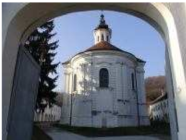
Манастир Врдник (са улазне капије)