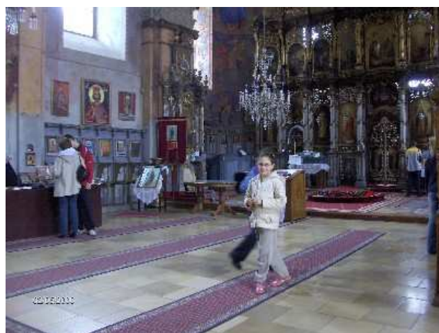
Inside of the Church