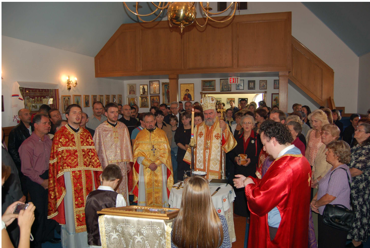
Света Литургија-недеља 24. септембар

После Свете Литургије у нашој сали је, уз пригодан програм и поздравне речи, послужен и свечани ручак, као и увек у припреми наших вредних сестара.