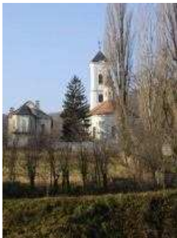
Поглед на манастир Врдник

По предању основан је у време Серафима митрополита сремског још пре доласка Турака али први пут се помиње у турском попису 1566-67. г. Г. као манастир Светог Јована чији су монаси били присиљени да га напусте јер нису имали да плате намете Турцима. У напуштеном и разореном манастир стижу монаси из Раванице из Србије током велике сеобе Срба и насељавају Врдник 1697 г. Г. и доносе свете мошти кнеза Лазара и раваничку ризницу. Од тада се Врдник назива Раваницом. Монаси су обновили Цркву и успоставили ново посвећење празнику Вознесења Христовог. Пошто се култ кнеза Лазара брзо ширио међу Србима од 1801. до 1811. г. Г. је изграђена нова Црква и свете мошти су унете у њу на Видовдан 1811. г. Г. па је тако ово постала слава манастира.