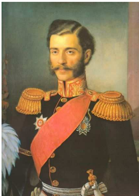
Кнез Михаило Обреновић

По очевој смрти на власт долази његов млађи син Михаило овај пут као искусан образован човек и велики познавалац Европских прилика. Михаило је веровао да Србија мора да се припреми за велики рат против турака који би значајно коначно ослобођење и уједињење свих Срба. На овом плану је провео наредних 8 година