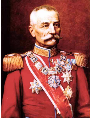
Краљ Петар Први Карађорђевић

Нова влада састављена је сутрадан по атентату. У владу Јована Авакумовића ушли су представници свих странака, а завереници су задржали војно министарство. Војска је прогласила кнеза Петра Првог Карађорђевића за краља а скупштина је то једногласно потврдила 15. јуна 1903. г. Г. Исте године проглашен је нови устав и краљ Петар је положио заклетву 25. јуна. Србија је тада постала парламентарна монархија.