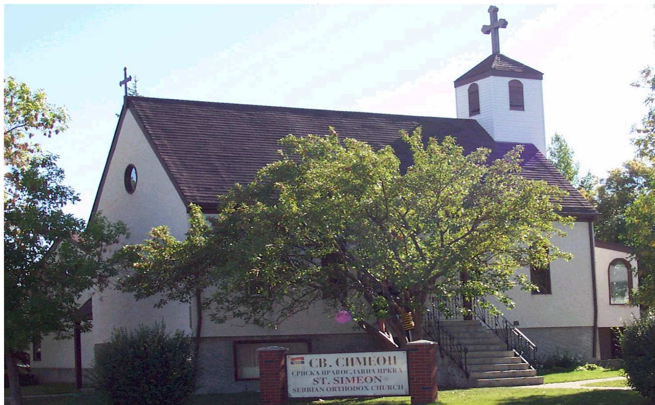
Српска Православна Црква Светог Симеона Мироточивог у Калгарију Serbian Orthodox Church St. Simeon Mirotocivi in Calgary