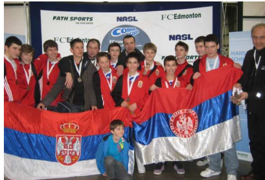
СД Србија испод 16 година (сребро и бронза)

Овог љета је СД Србија регистровала тимове за дјецу испод 10, 12 и 16 година старости, уз два тима одраслих играча преко 18 и 45 година старости. Посебно нас радује да се глас о квалитетном раду у нашој Академији шири градом и да већ сада имамо преко 20% изузетно талентоване дјеце која су дошла из других клубова. За све оне који желе да им дјеца уче фудбал у Српској Фудбалској Академији и да се такмиче за клуб СД Србија, могу нам послати е-маил на info@sdserbia.ca