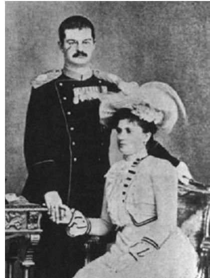
King Aleksandar and Draga

After an unsuccessful assassination attempt on Milan Obrenovic the Radical party was held responsible and two of their representatives, Stojan Protic and Ljubomir Zivkovic, were sentence to 20 years in prison. The Radical party moved forward with the help of the another progressive political organization. This lead to a new constitution passed by the King in 1901. This constitution was somewhere between the 1869 and 1888 versions.