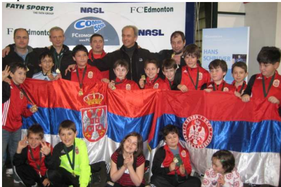
СД Србија испод 12 година (сребро и злато)

У мају 2009. је отворена Српска Фудбалска Академија гдје је око четрдестак дјеце научило прве фудбалске кораке. Већ у септембру 2009. су основана два тима састављена од дјеце испод 12 и 16 година старости. Они су у току “indoor” сезоне 2009/2010 овојили двије сребрене медаље у првенству Калгарија, те бронзану и златну медаљу на нивоу провинције (Inter-Cities) и унијели превелику радост у нашу заједницу. Слиједи фотографије наших тимова за дјечаке испод 12 и 16 година старости са такмичења у Едмонтону 13-14 марта 2010.