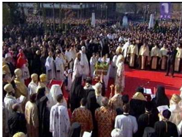
Опело испред храма Св. Саве