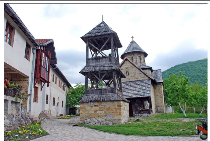
Манастир Благовештење Овчарско-кабларска клисура

Сам манастир део је комплекса манастира у Овчарско-кабларској клисури који многи сматрају Српском Светом Гором.