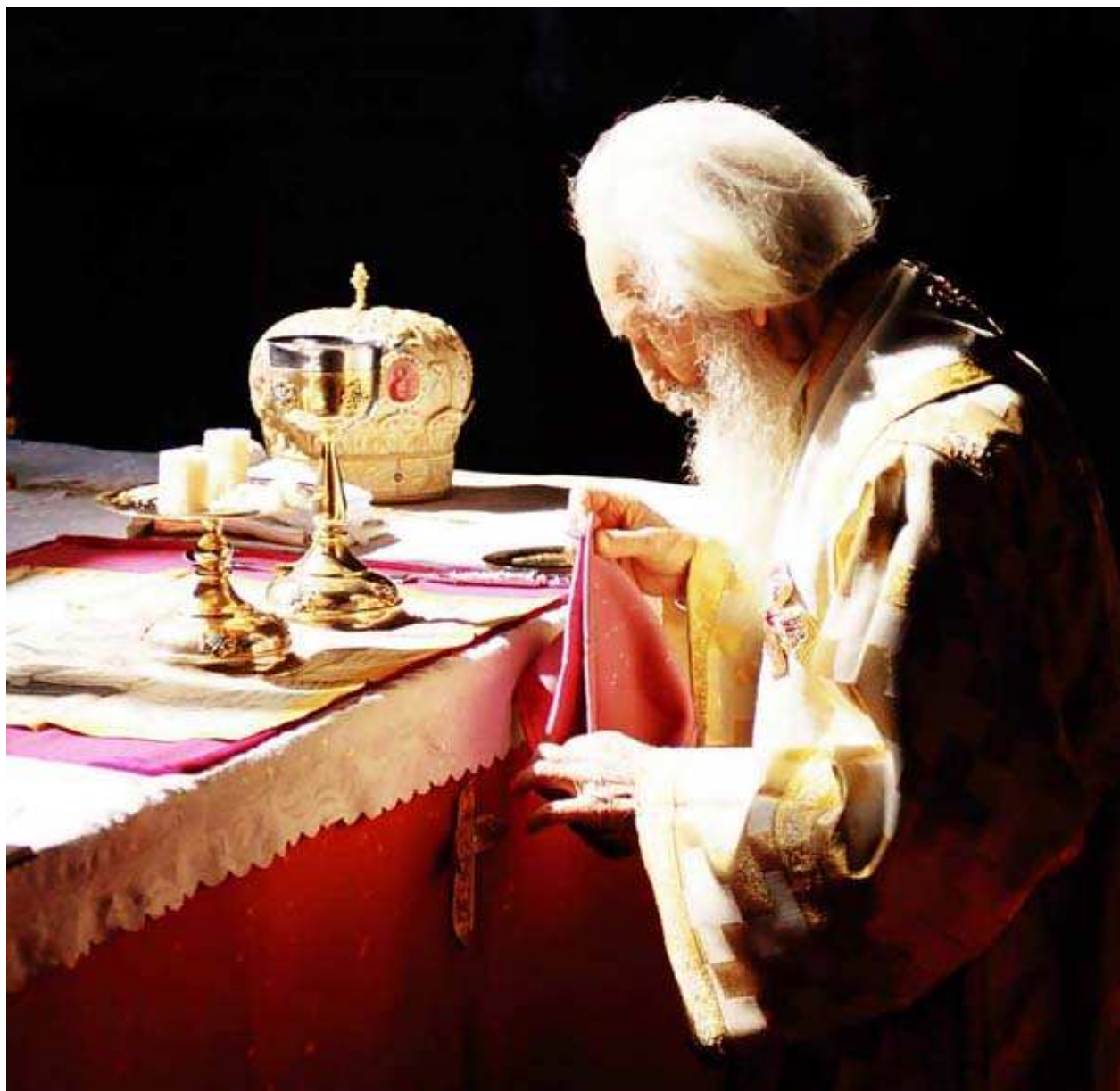
Истинити слуга истинитог Бога Његова светост Архиепископ Пећки, Митрополит Београдско Карловачки и Патријарх Српски Павле